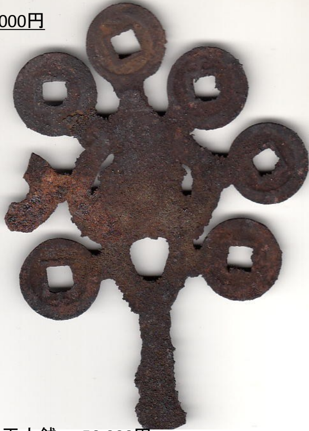
9 栗林 隆平大銭 50,000円