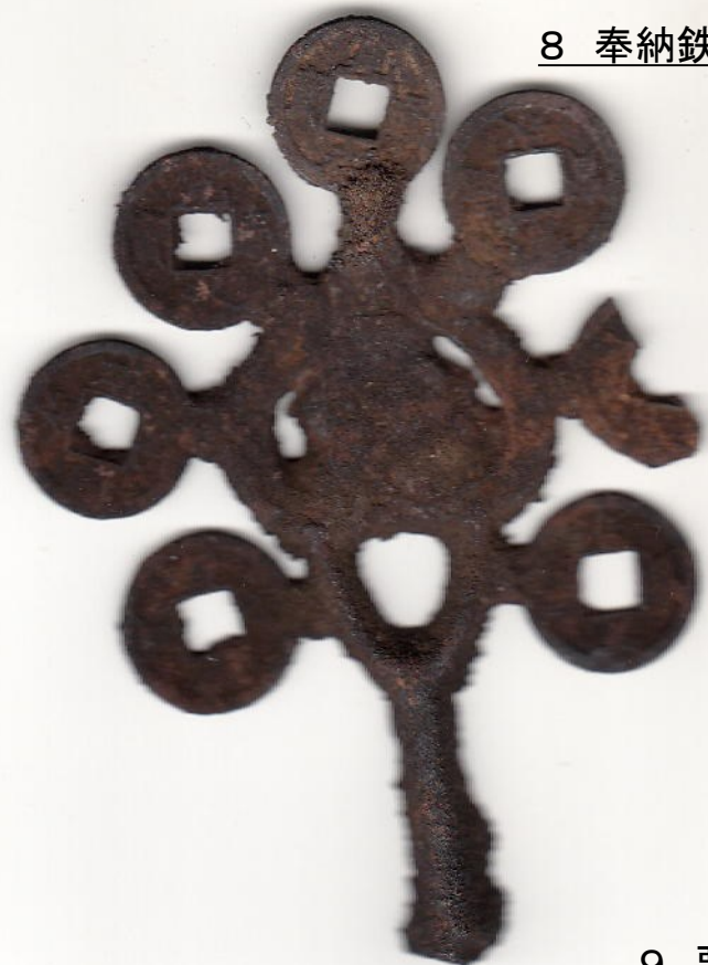
8 奉納鉄銭 50,000円