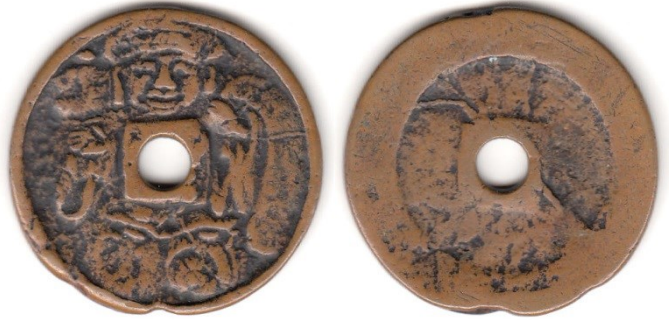
3 根付大黒の南部写 55,000円