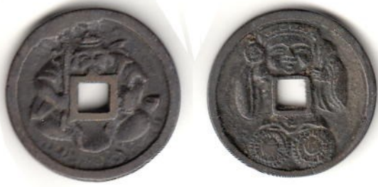
1 花巻恵比寿大黒 50,000円