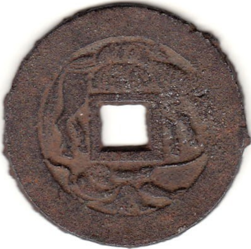
4 大迫駒引 鉄 68,000円